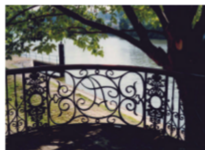
Vue sur la Seine depuis le balcon du restaurant

Le musée de la Maison Fournaise présente une collection de peintures et d'archives sur l'histoire de la maison et l'âge d'or des bords de Seine.