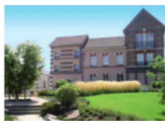
La Maison Levanneur, aujourd'hui.

André Derain (né à Chatou) et Maurice de Vlaminck louent un atelier en 1900 dans une maison voisine du restaurant Fournaise, la Maison Levanneur. Guillaume Apollinaire et Henri Matisse leur rendent visite. Les deux peintres qui appartiennent au mouvement fauve incarnent à leur tour l'avant-garde picturale durant les premières années du XX ème siècle.