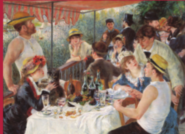
Pierre Auguste Renoir, Le Déjeuner des canotiers , 1880-81, Washington, Phillips Collection