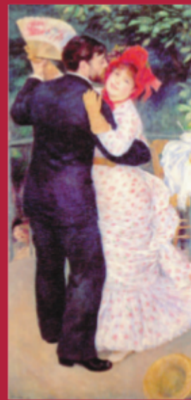
Pierre Auguste Renoir La Danse à la campagne , 1883 Paris, musée d'Orsay