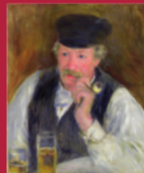
Pierre Auguste Renoir Le Père Fournaise , 1875 Williamstown, Sterling & Clark Institute