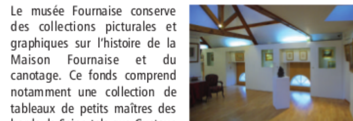
Une des salles du musée Fournaise

Pour découvrir ou revoir les collections du musée, consultez le site Internet Joconde du ministère de la Culture : www.culture.gouv.fr/documentation/joconde