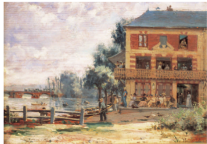
Maurice Leloir, La Maison Fournaise , 1876, Chatou, musée Fournaise

Célèbre guinguette des bords de Seine, le charme du lieu attire Renoir. Sur le balcon de la maison, il peint son célèbre Déjeuner des canotiers à la fin de l'été en 1880.