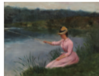
Ferdinand Heilbuth, Jeune élégante pêchant sur l'île de Croissy , Chatou, musée Fournaise

Parmi les œuvres remarquables de la collection se trouvent une sculpture en bronze signée par Renoir et Guino ainsi que des paysages de Chatou peints par André Derain.